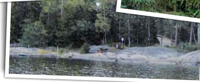
Rastplatsen där du kan lägga till båten