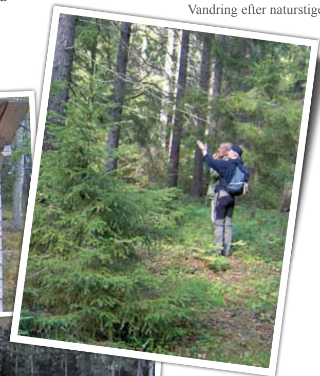
Vandring efter naturstigen