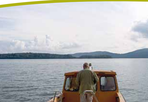
Båttur till Vålön