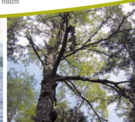
Den lummiga skogen