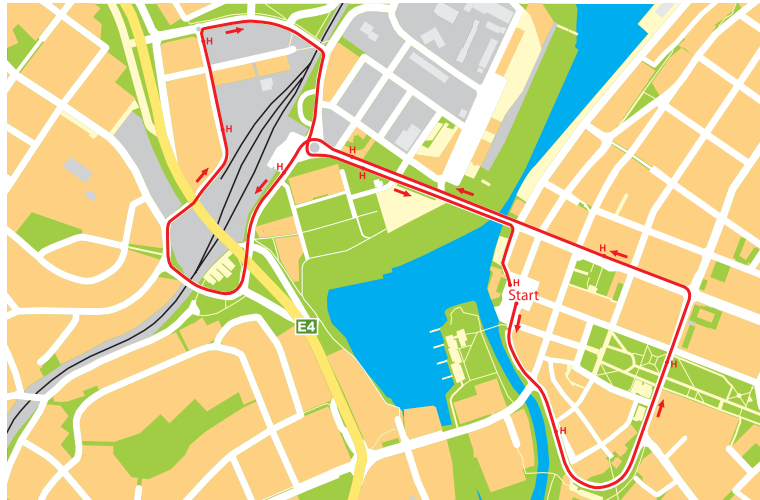
Så här kommer den nya centrumlinjen att gå mellan stadskärnan och det nya handelsområdet.