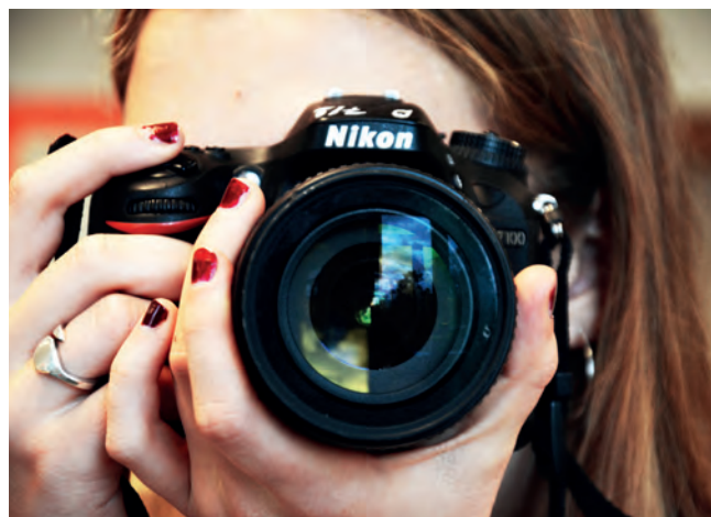
En av inriktningarna på samhällsvetenskapsprogrammet fokuserar på medier, information och kommunikation.