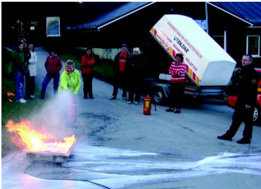
Utbildning i brandsläckning