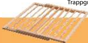
Trappgrind från IKEA

Ta därför en titt på en tipslista med 15 punkter på vad som kan vara bra att tänka på för att skapa ett barnsäkert hem.